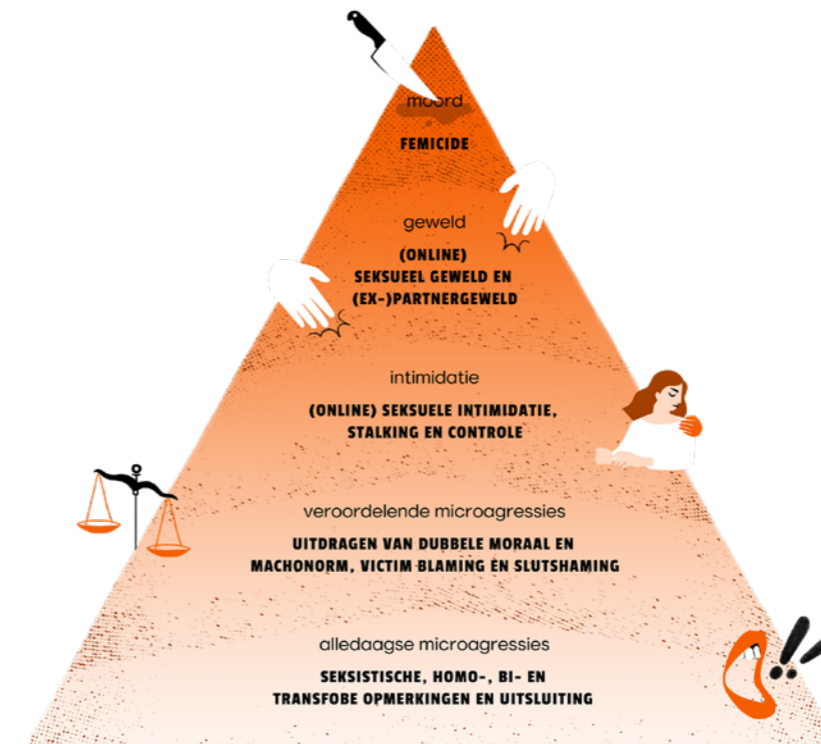
Piramide van Geweld, illustraties door Caroline Cracco, 2025, Act4Respect

Eerste Nederlandse onderzoek naar ervaringen van intersekse personen met seksueel geweld en seksueel grensoverschrijdende ervaringen (samenwerking met NNID) Intersekse personen krijgen vanaf jonge leeftijd te maken met seksueel geweld en seksueel