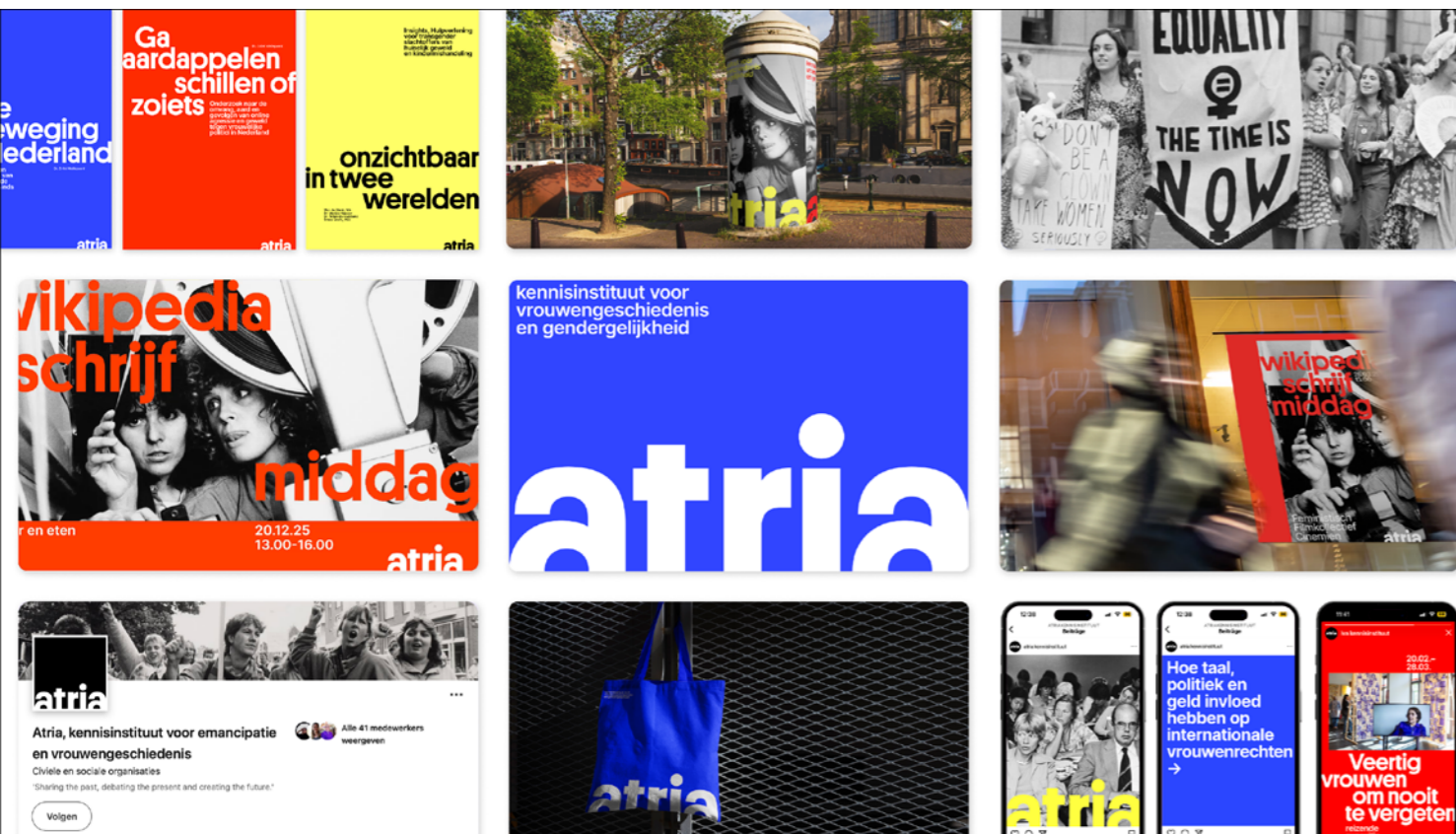
Nieuwe visuele identiteit van Atria

De eerste publieke manifestatie van de nieuwe visuele identiteit kwam met de lancering van de vernieuwde website. Met een eigentijdse look en feel en inhoudelijke aanpassingen die aansluiten bij de strategische herpositionering van het instituut. Op 3 december 2025, de dag van het 90-jarig bestaan, is de vernieuwde corporate website online gegaan. De nieuwe website zet sterk in op kennisdeling en biedt met een heldere navigatie toegang tot verschillende soorten informatie, bronnen en dossiers die elk op een andere manier worden gepresenteerd en met elkaar worden verbonden. Met een verbeterde zoekfunctie kunnen bezoekers informatie makkelijker vinden. Voor (wetenschappelijke) onderzoekers en belangstellenden wordt een selectie van bronnen in context gepresenteerd. De site belicht vijf kernthema's in het domein van gendergelijkheid en vrouwengeschiedenis - feminisme, zelfbeschikking, genderstereotypering, economische gelijkheid en gendergerelateerd geweld – op verschillende niveaus van toegankelijkheid. Onderzoek, publicaties en rapporten op deze thema's zijn met achtergrondartikelen voorzien van extra context. De site geeft ook toegang tot de collectiewebsite collectie.atria.nl . Deze site wordt in 2026 herzien en in lijn gebracht met de nieuwe visuele identiteit.