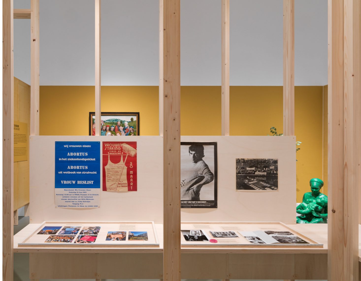
Bruikleen van 40 archiefstukken voor de tentoonstelling Good Mom/Bad Mom in Centraal Museum Utrecht, 2025, foto door Centraal Museum.