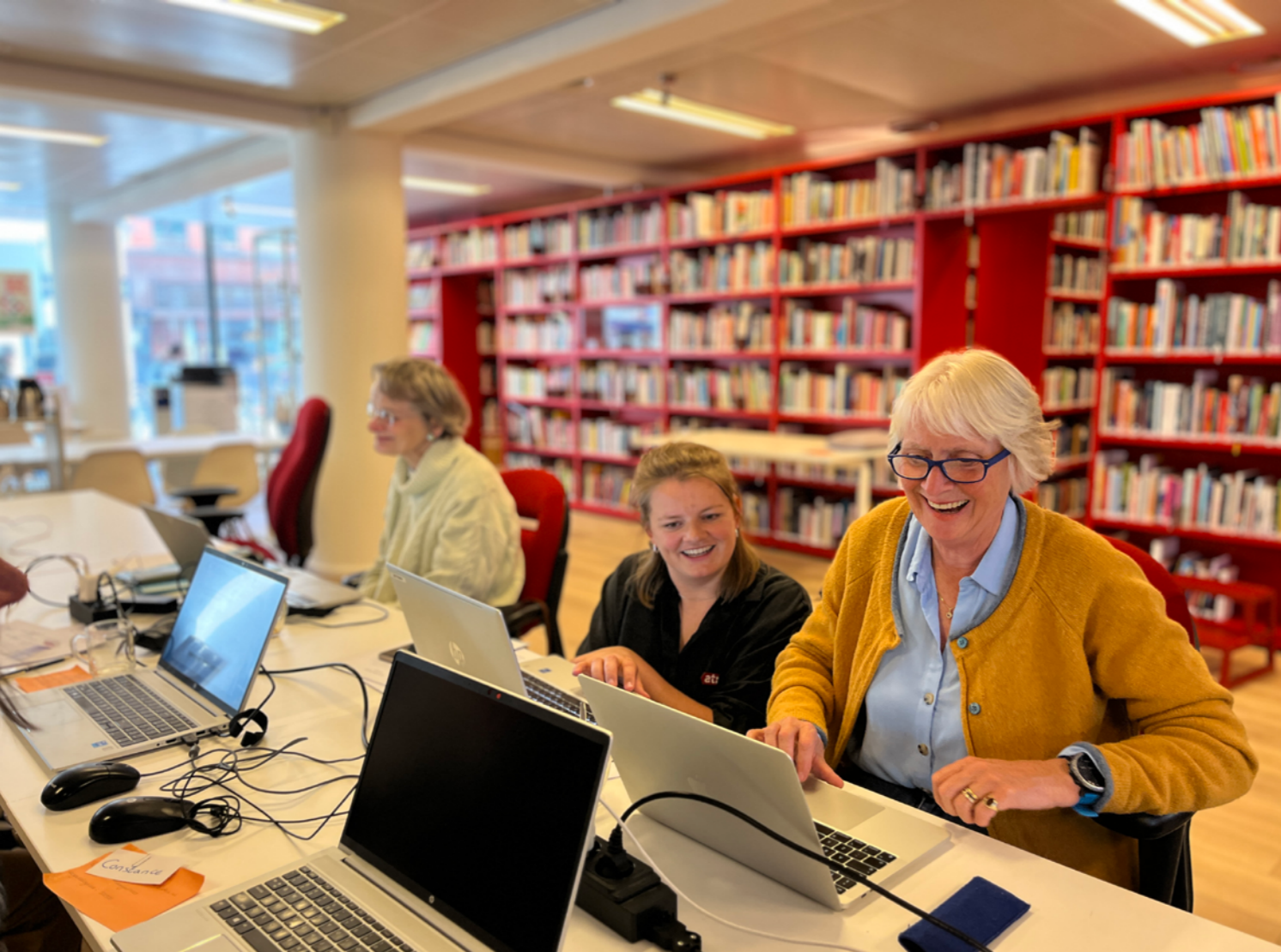
Deelnemers van de bijeenkomst Tesselschade Arbeid-Adelt op 9 mei 2025