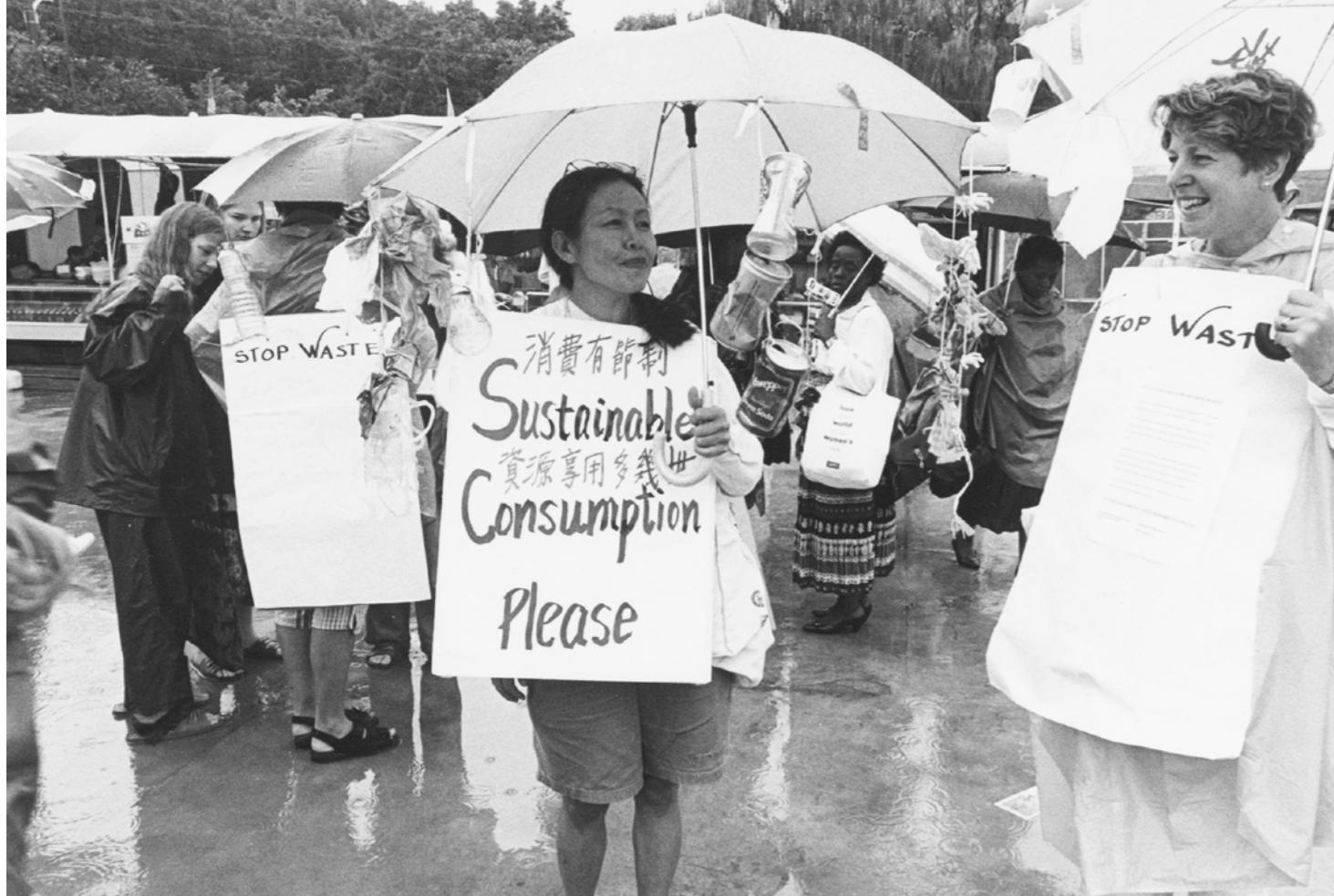
Beeld Beijing +30: Tijdens de Wereldvrouwenconferentie in Beijing worden vele acties gevoerd door vele organisaties, 1995, fotograaf: Mieke Schlaman, Collectie IAV-Atria.