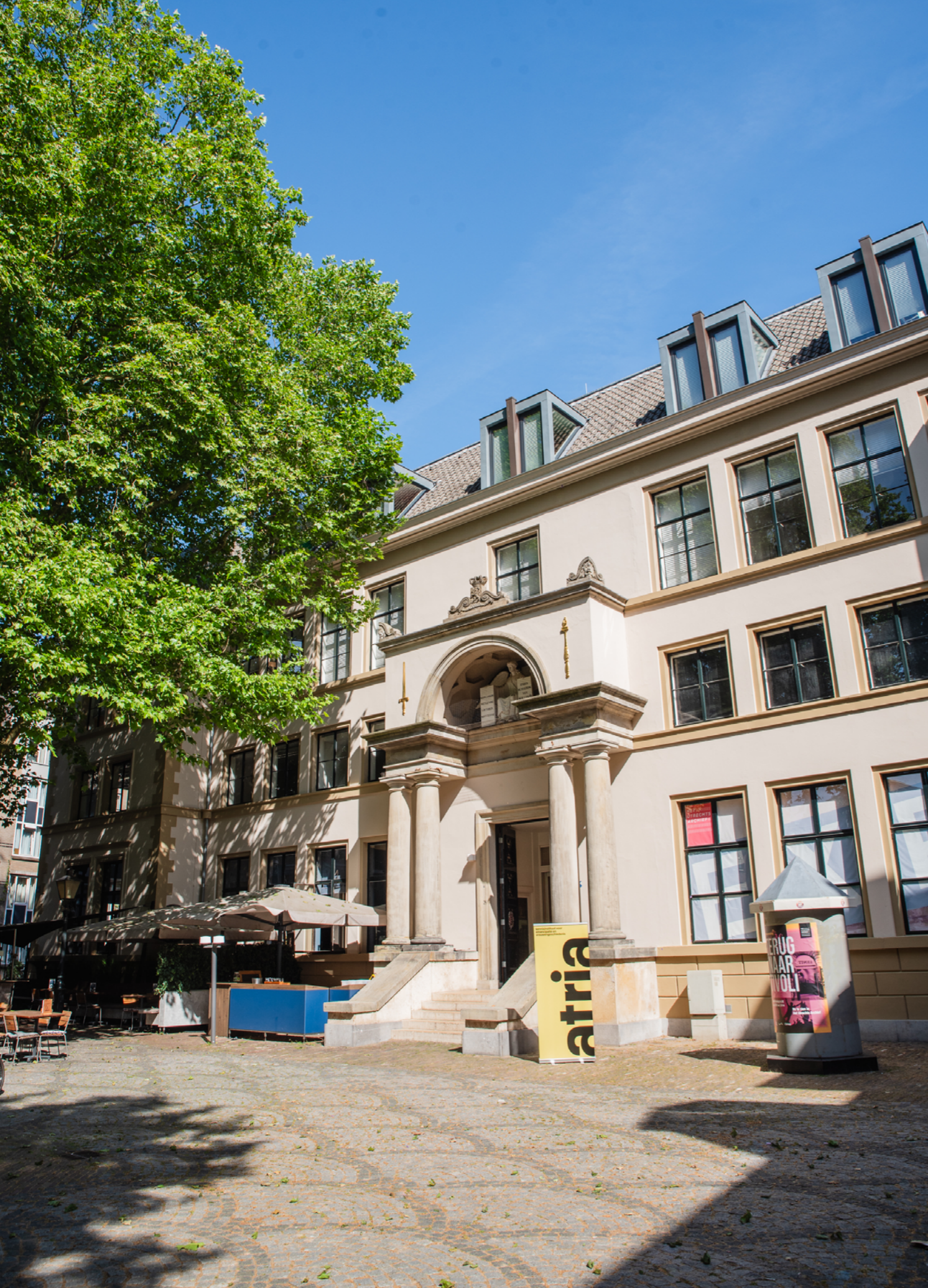
Hamburgerstraat 28A, foto: Caecilia Rasch, 2026